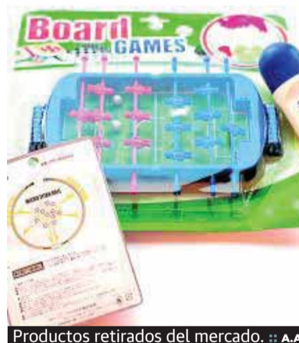
Productos retirados del mercado.

La positiva labor que realiza el servicio municipal de Consumo ha permitido que el pasado año hayan sido retirados del mercado hasta 3.000 productos de cosmética, entre otros, tras la inspección que realizaron sus profesionales. Esta labor impide que lleguen al consumidor productos que no reúnen las condiciones mínimas de seguridad y calidad y es una garantía para que el ciudadano confíe en disponer en el mercado de productos que valen lo que se ha pagado por ellos.